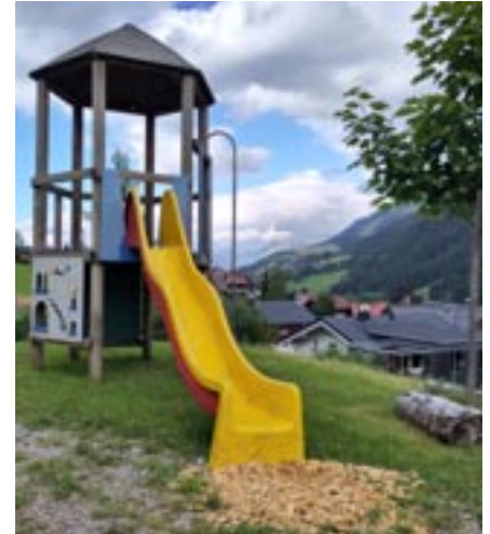
(noch der alte Spielplatz)

Mail: kreuzkirche.kleinwalsertal@elkb.de